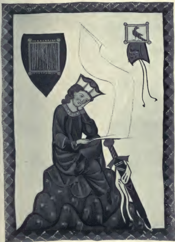
Walther von der Vogelweide Miniatur der Manessischen Handschrift